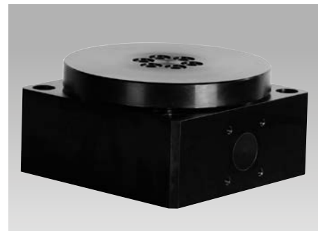
Drehmodul-vertikal DMV 1000 mit Flanschplatte Ø 170